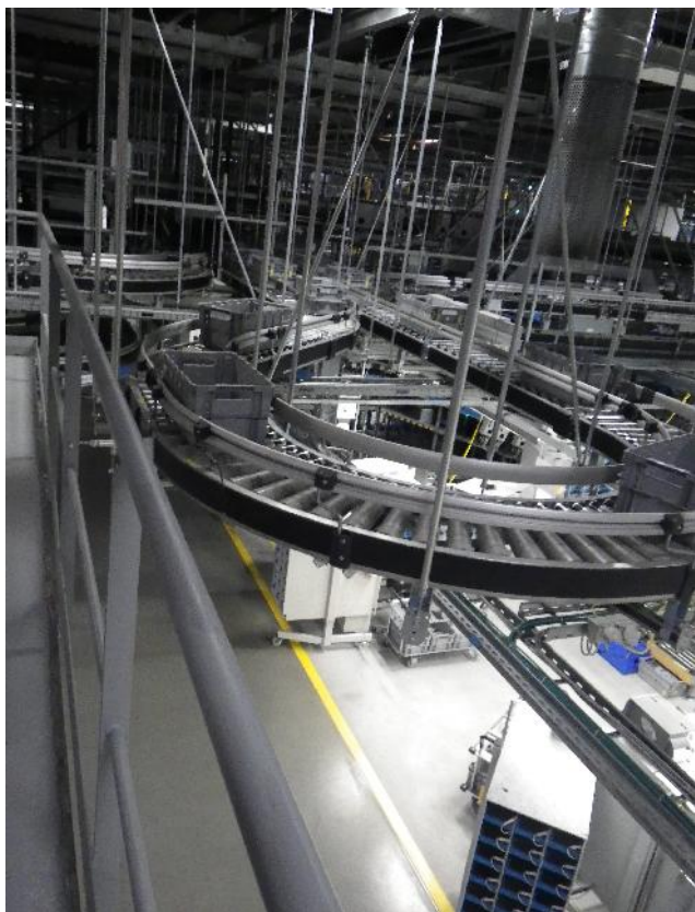
C'est vraiment le grand huit...