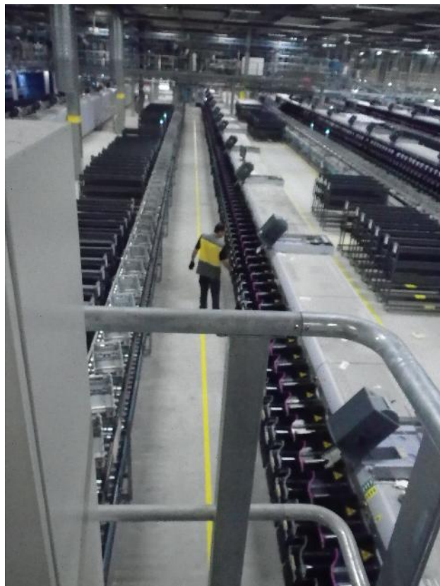
Mieux qu'à Disneyland. Mais surtout : Bravo à ceux qui s'y retrouvent !