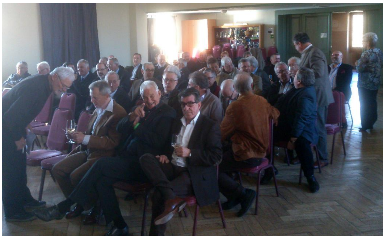
Une assemblée bien fournie!...