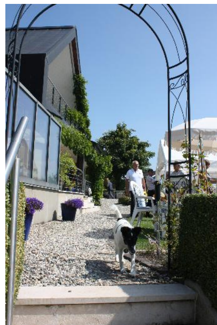
Kidjo mène son inspection