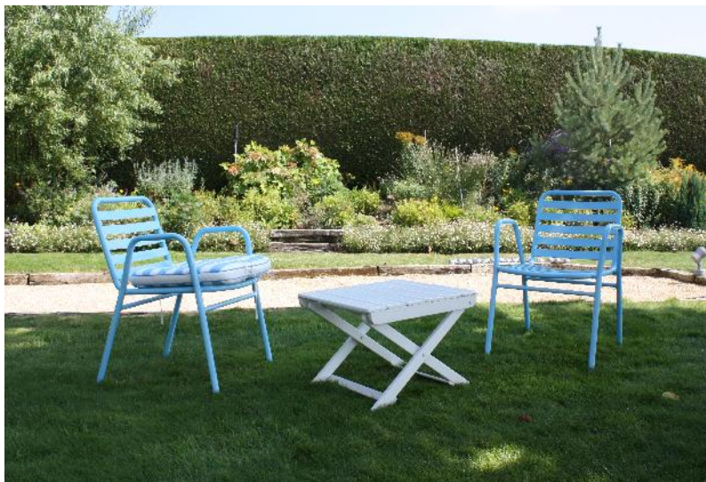
Terrain de pétanque à l'ombre pour le pastis