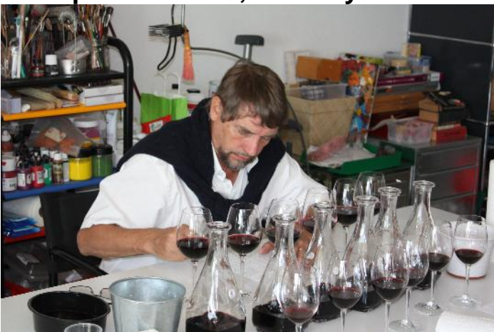
Dégustation et questionnaire sur le vin