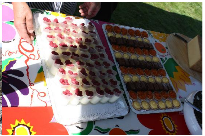
Des grillades sur fond de rêve et des rêves sous forme de desserts