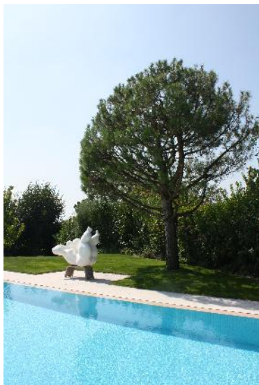
La seule baigneuse se tord de rire!