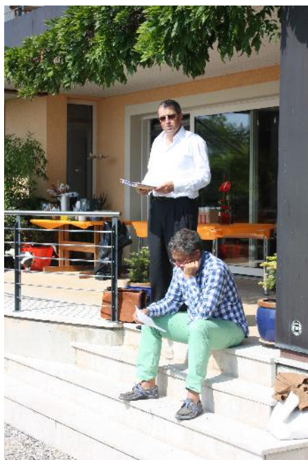
Jean-Pierre a un problème que le président ne parvient pas à dissiper!

Thème: L'organisation Mercier était parfaite, d'ailleurs à l'heure où vous recevez ce bulletin je ne suis pas sûr que tout le monde soit déjà parti.