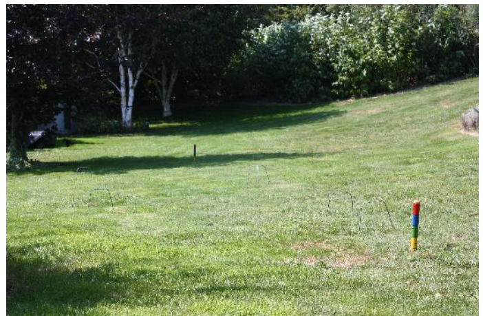
Terrain de croquet