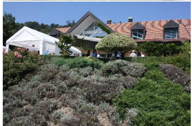
Voici pour le cadre, mais il y a encore toutes les attractions: