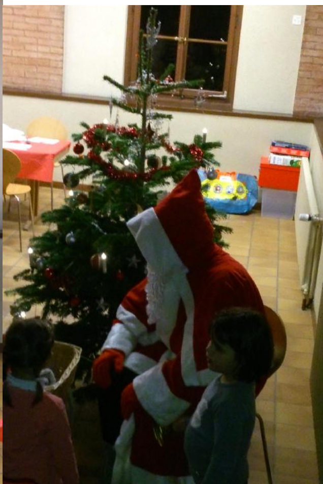
Rude concurrence pour Michel (la barbe peut-être?)