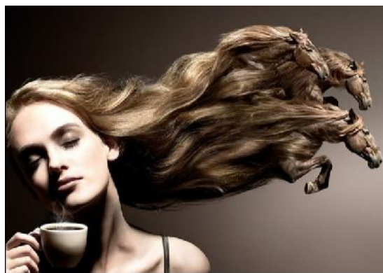
IENA Institut Equestre National Avenches