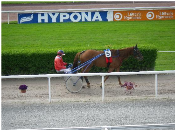
Le cinq qui devait gagner des millions!!!

Grâce au PMU, l'IENA reçoit environ 100'000.- Frs par jour de courses: Il y a un pot commun européen avec les montants encaissés, qui est redistribué selon un barème précis. Lors de notre visite les paris encaissés se montaient à plus de 2 millions d'Euros!