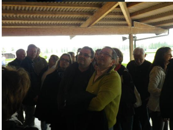
C'est un flop, les écrans sont formels! Oooh!